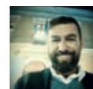
A cura di Enzo Santarelli ...dal 1970

Editore e proprietario del periodico Blu news dal 2012. Giornalista pubblicista Laureato in giurisprudenza Specialista in diritto ed economia dello sport nella U.E.