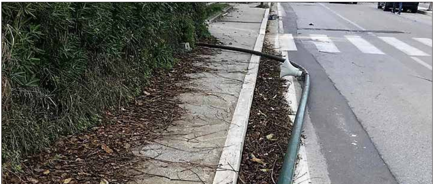
palo pubblica illuminazione caduto su auto il 27 ottobre 2018 su lungomare Trento

Nello stesso giorno ne è caduto un altro su Lungomare Trieste