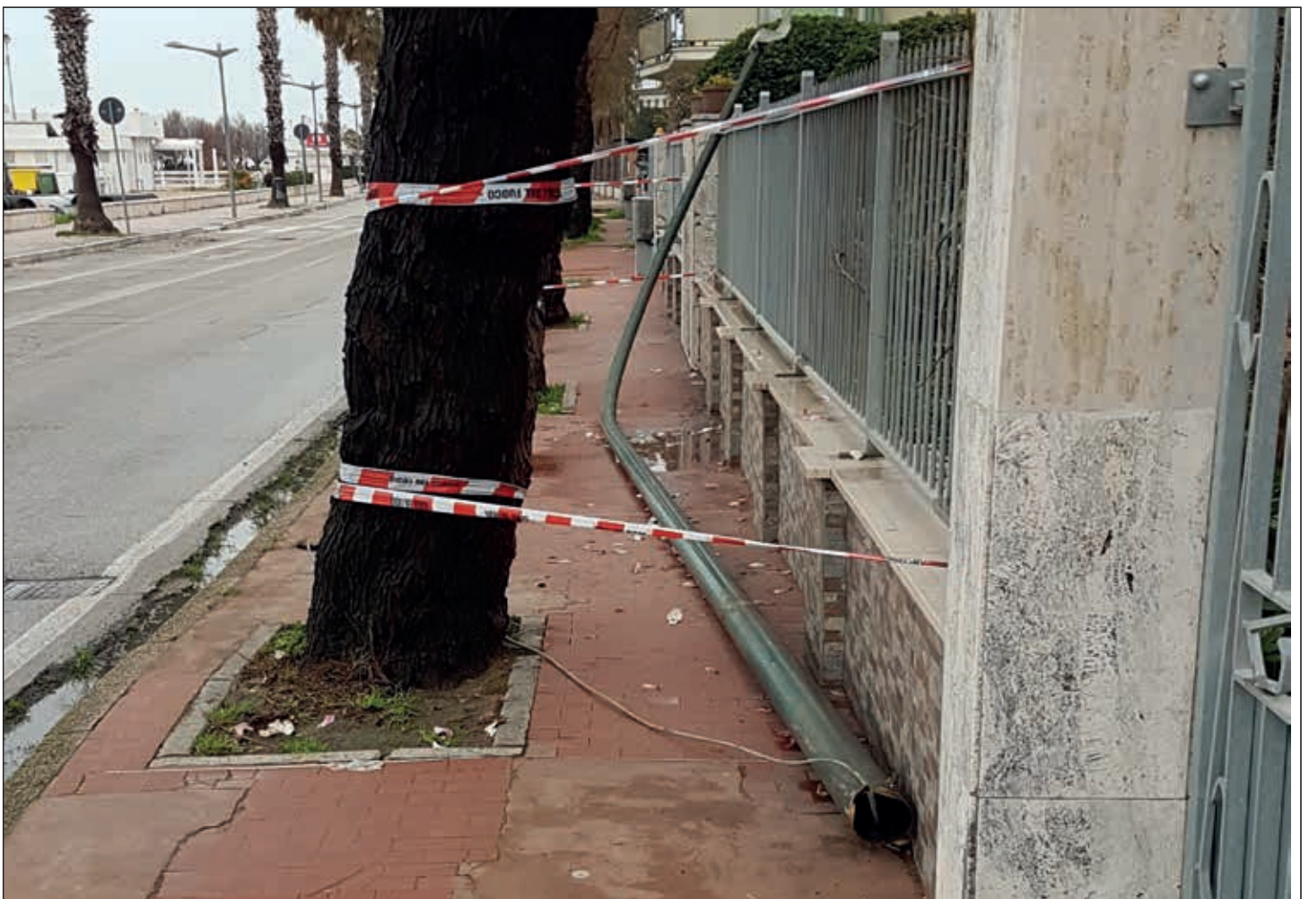
palo pubblica illuminazione caduto il 17 marzo 2018 Lungomare Trieste

E' chiaro, comunque, che prima di 6 mesi i lavori del project non partiranno. Quindi, cari cittadini, speriamo in queste verifiche... consideriamolo un primo passo!