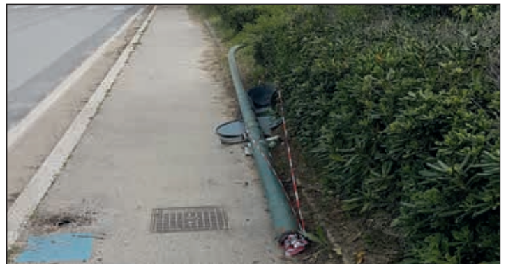
palo pubblica illuminazione caduto il 18 aprile 2018

La situazione della pubblica illuminazione a Roseto, infatti, è molto critica soprattutto sul lungomare dove, nell'ultimo anno e mezzo, sono caduti ben 5 pali, e in due casi si è sfiora-